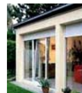
Volets et persiennes